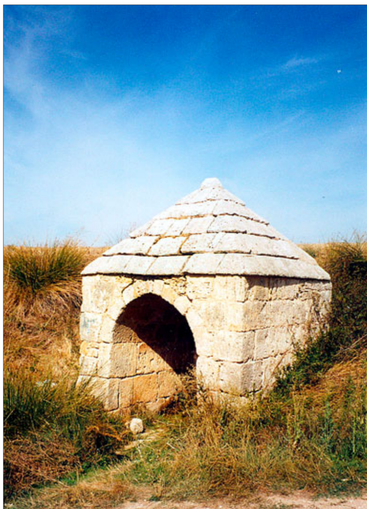
Aspecto que presenta la fuente de La Esperilla, rodeada de vegetación.

La fuente de La Esperilla no es ajena al paso de los siglos y actualmente presenta un importante deterioro en su estructura, de piedra de sillería, tanto en los muros como en su bóveda donde se aprecia el hundimiento de algunas piedras y cómo la vegetación ha ido